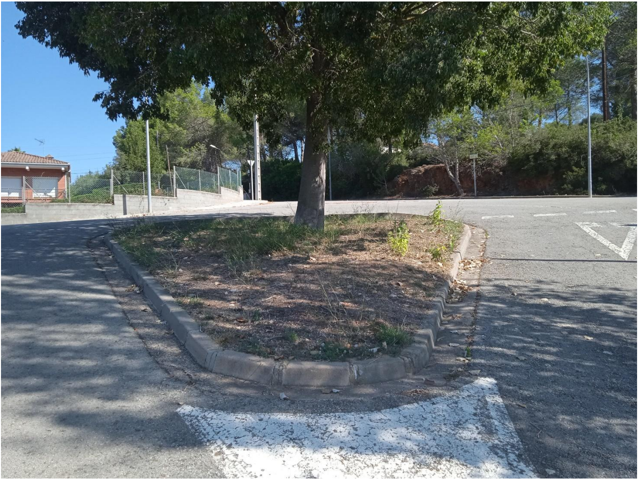
Espai ubicat al final del carrer Gimeno Navarro, en el punt més alt