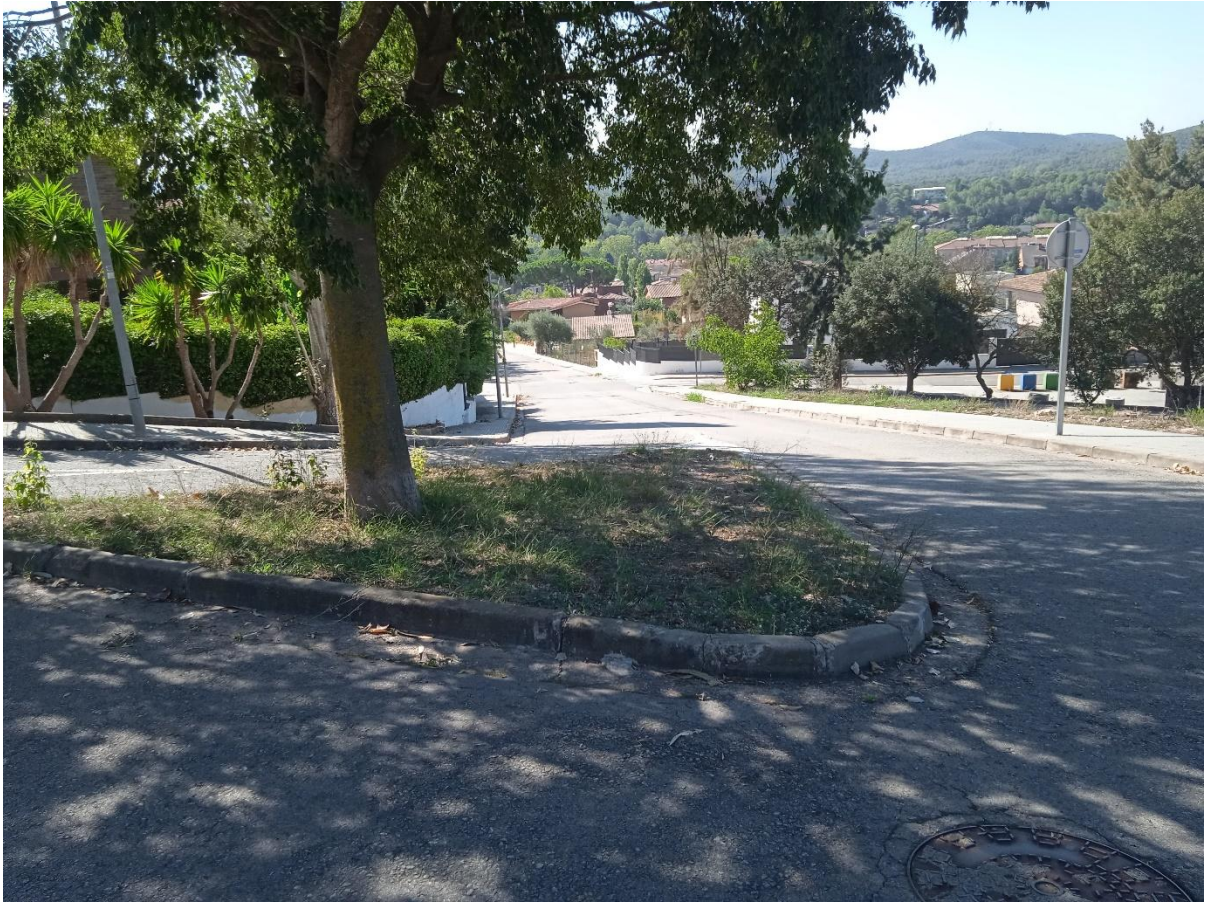
Espai de descans, prendre la fresca, gaudir del paisatge i panoràmica