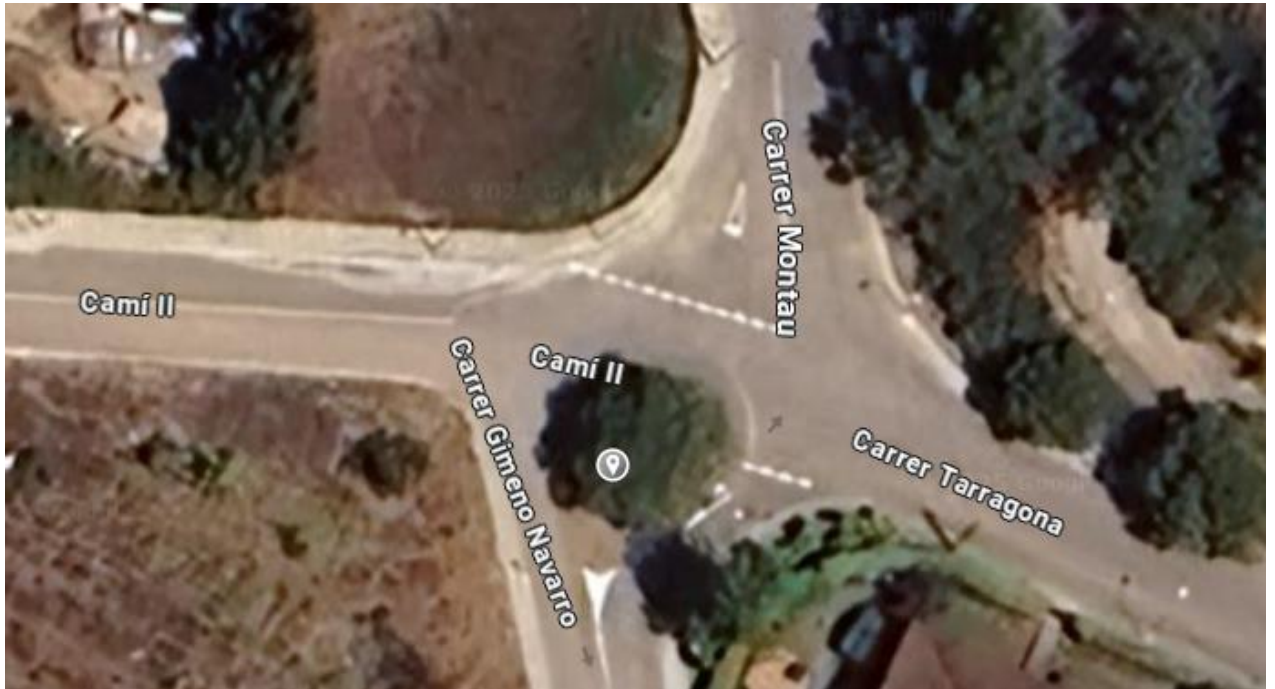
Plànol de situació