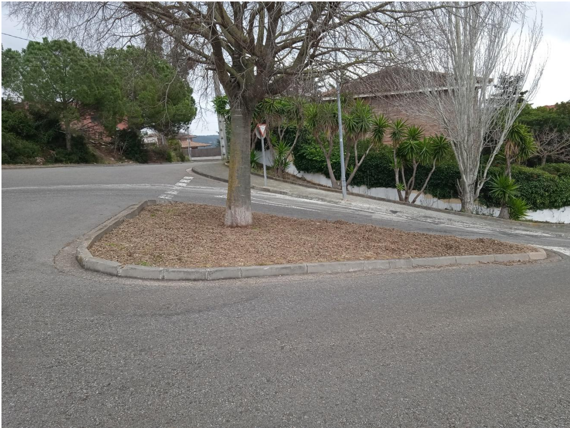
Accessibilitat per part superior i inferior